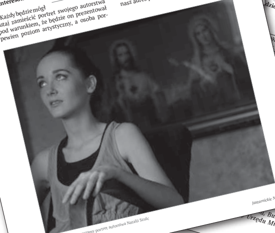
Na poczetek zamieszczamy portret autorstwa Natalii Szulc.

Każdy będzie mógł tutaj zamieścić portret swojego autorstwa pod warunkiem, że będzie on prezentował pewien poziom artystyczny, a osoba portretowana wyrazi zgodę na zamieszczenie go w gazecie. Przewidujemy przede wszystkim zamieszczenia portretów fotograficznych, jednak nie wykluczamy także zamieszczenia rysunków. Wszystko zależy od jakości nadsyłanych prac.