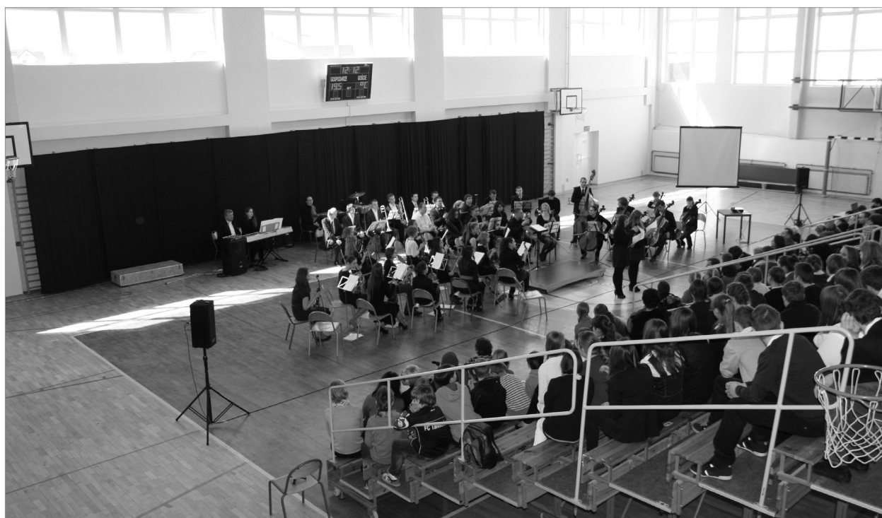
Orkiestra Młodych Talentów składa się z ponad 30 muzyków

niem utworu „Gaude Mater Polonia”, później zaś orkiestra dała godzinny koncert muzyki klasycznej. Równocześnie wyświetlana była prezentacja pod tytułem „Dekalog w nauce Jana Pawła II”. Organizatorami koncertu byli: Gimnazjum im. Jana Pawła II oraz Miejski Ośrodek Kultury, Sportu i Rekreacji w Jastarni.