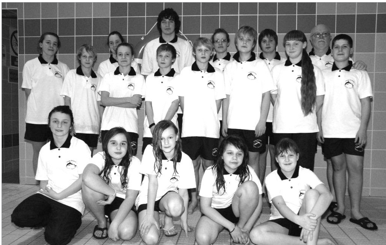
Klub pływacki UKS Delfin Jastarnia w pełnym składzie

Obecnie zawodnicy UKS Delfin Jastarnia przygotowują się do zawodów o puchar PRO we Wrocławiu, Grand Prix Polski w Olecku i czwartej rundy Klubowego Pucharu Świata, który odbędzie się w połowie maja w Gliwicach.