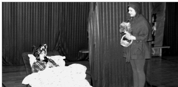
Rozwijająca się na scenie akcja sztuki była śledzona z najwyższym zaciekawieniem

W poniedziałek 8 kwietnia uczniowie Gimnazjum im. Jana Pawła II w Jastarni zorganizowali przedstawienie „Czerwony Kapturek” dla swoich młodszych kolegów ze Szkoły Podstawowej. Maluchy oglądały spektakl z takim zaciekawieniem, że na widowni nie było żadnych rozmów, słyszanych często przy innych takich okazjach.