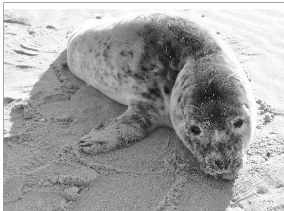
Uratowana foka.

chwili zjada ryby w całości. Maluch otrzymał imię Sybir od nazwy osiedla Syberia w Kuźnicy, na wysokości którego go znaleziono. Cały czas trwa leczenie. Rokowania na razie są ostrożne, ale stan foki jest już w miarę stabilny. Pracownicy Stacji Morskiej w Helu dziękują spacerowiczowi, który powiadomił Stację Morską o napotkanym zwierzęciu i w ten sposób przyczynił się do jego uratowania oraz Panu Adamowi Rzeźnickiemu za pomoc w zlokalizowaniu zwierzęcia.