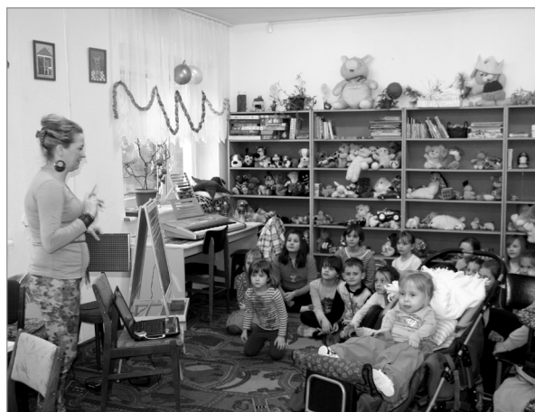
Aktywne ferie uczniów z Jastarni

W dniach 16–22.02 odbyło się natomiast zimowisko w Warzenku koło Kościerzyny, organizowane przez Caritas województwa pomorskiego, z którego skorzystało 8 dzieci z Jastarni.