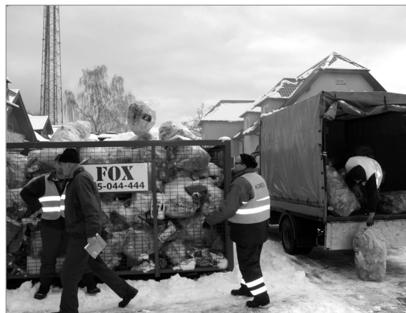
Pracownicy „Komexu” sortują zebrane worki z posegregowanymi odpadami