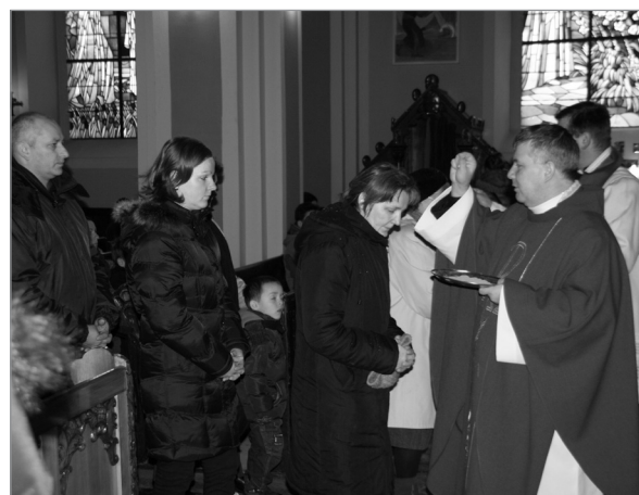
Kolejki wiernych do posypania głów popiołem były na wszystkich mszach bardzo długie

W jastarnickim kościele tego dnia na wszystkich mszach było bardzo dużo ludzi, gdyż wszyscy chcieli w ten sposób rozpocząć Wielki Post, a tym samym dobrze się przygotować do świąt wielkanocnych.