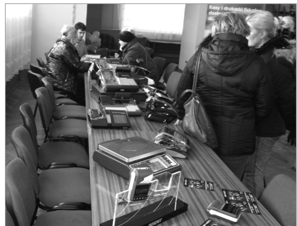
Spotkanie trwało kilka godzin i wzbudziło spore zainteresowanie naszych mieszkańców