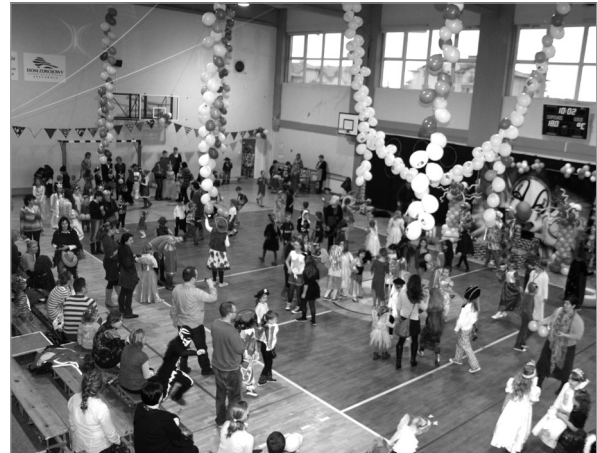
Organizatorami balu był jastarnicki MOKSiR i Rada Rodziców Szkoły Podstawowej