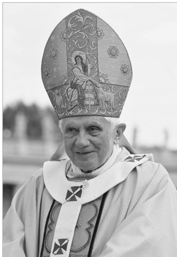
Benedykt XVI

Zakończenie remontu sali pierwotnie zaplanowano na 5 marca, jednak prace prawdopodobnie zakończą się wraz z powrotem uczniów z ferii, by w trakcie zajęć szkolnych sala był już w pełni dostępna.