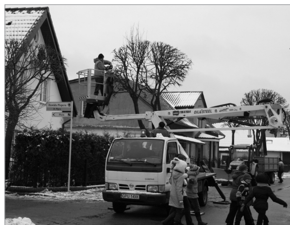
Właśnie teraz jest najlepszy okres na pielęgnacyjne przycinanie drzew

Na terenie naszej gminy znajduje się 1279 drzew do przycięcia.