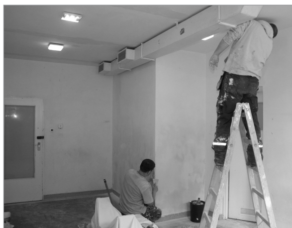
Przed malowaniem trzeba było wypełnić wszelkie ubytki w ścianach.