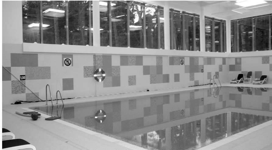
Cały kompleks sportowo-rekreacyjny przedstawia się naprawdę imponująco

kie osiągnięcia w pływaniu, powinno wzbudzić spore zainteresowanie.