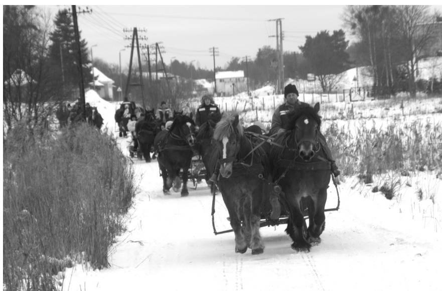
Wszyscy uczestnicy kuligu świetnie się bawili

zima, można zorganizować imprezę, podczas której można się świetnie bawić, o czym mogą zaświadczyć wszyscy uczestnicy tego kuligu.