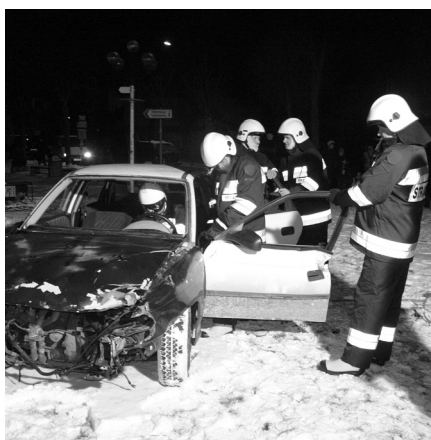
Główną atrakcją dnia był pokaz ratownictwa zaprezentowany przez strażaków

orkiestry dętej. Przez cały czas można było też zakupić upominki na szczęście, wykonane przez miejscowych gimnazjalistów. Ogółem zebrano 5.133,88 zł, czyli więcej niż w roku ubiegłym, kiedy to do skarbonek wrzucono 4.868,15 zł.