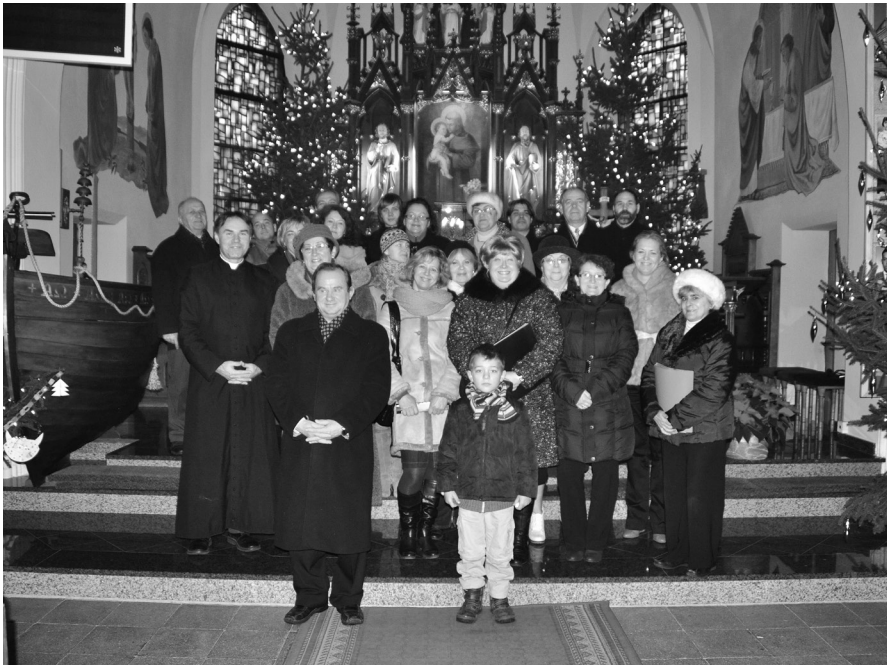
W Święto Trzech Króli, chór wystąpił w kościele w Kuźnicy.