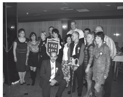
Klasa b Szkoły Podstawowej w Jastarni po 36 latach

Zaproszono także wychowawczynie trzech oddziałów, do których uczęsz-