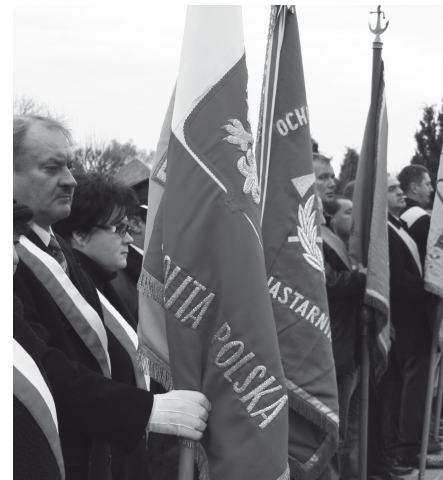
Złożenie kwiatów na cmentarzu było pierwszym patriotycznym akcentem tego dnia.

Rozpoczęło się jak na koncert patriotyczny przystało, od wykonania hymnu państwowego. W dalszym programie koncertu znalazły się pieśni patriotyczne: „O mój rozmarynie”, „Jeszcze jeden mazur dzisiaj” i „Rozkwitały pęki białych róż”, utwory muzyczne z filmów: „Walc Barbary” z „Nocy i dni”, temat z filmu „Dom” oraz walc z „Ziemi obiecanej”. W programie znalazł się także „Kanon D-dur” J. Pachelbela, koncert A-mol op.3 A. Vivaldiego, Nokturn As-dur F. Chopina, „Obertas” H. Wieniawskiego, „Ave Maria” Schuberta i „Aria na strunę G” J.S. Bacha.