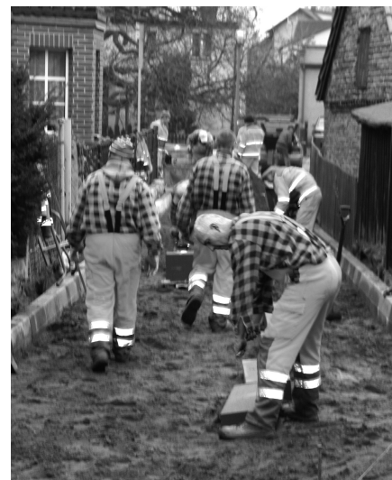
Wymiana nawierzchni części ul. Spokojnej

Przetarg na wykonanie nawierzchni z kostki brukowej wygrała firma ZAMBRUKO z Redy za 80 tysięcy złotych. Czas realizacji inwestycji wyznaczono do 20 XII, jednak wykonawcy uwinęli się z tym około pięćdziesięciometrowym odcinkiem w nieco ponad tydzień.