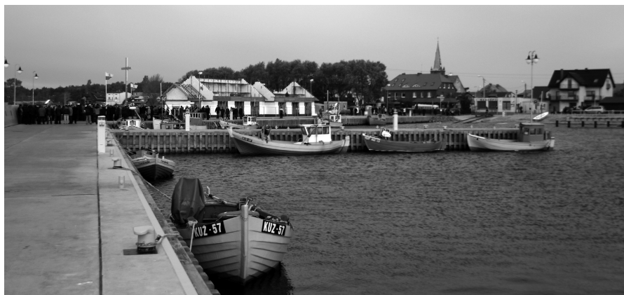
Port w Kuźnicy wykonano w przeciągu półtora roku

gości ok. 174 m, falochron wschodni o długości ok. 110 m, umocnionego brzegu skarpowego o długości 154 m po północnej stronie basenu przystani, dwa pirsy postojowych przy falochronie południowym, monitoring przystani, pochylnię do wodowania mniejszych jednostek przy nabrzeżu północnym, budynek bosmanatu wraz z zapleczem sanitarnym dla rybaków oraz zjazdem dla niepełnosprawnych, wyremontowano zachodnie nabrzeże postojowo-wyładunkowe o długości ok. 92 m wraz z modernizacją oznakowania nawigacyjnego, sieci energetycznej, wodociągowej i oświetlenia. Wydatkowane środki pozwalają na stwierdzenie, że była to największa inwestycja w dotychczasowych dziejach Kuźnicy.