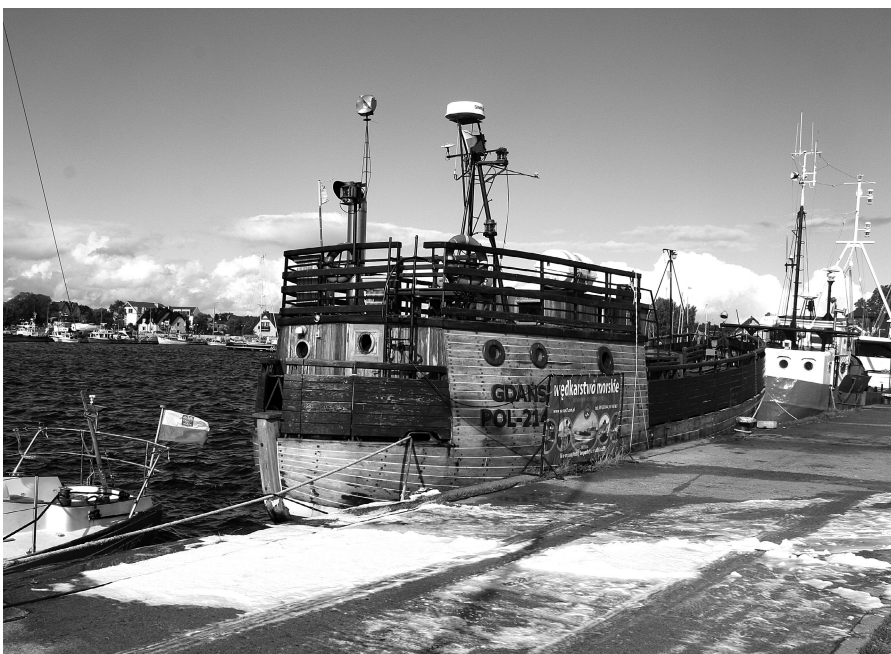
Z zewnątrz żadnych uszkodzeń na „Passacie” nie widać.

S tacjonujące w jastarniańskim porcie jednostki mają w ostatnich latach „szczęście” do pożarów.