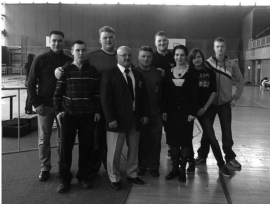
Zawodnicy Jastarni na Mistrzostwach, wraz z opiekunami i sędziami zawodów