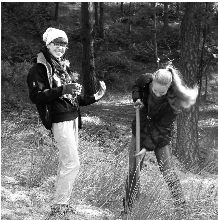
Sadzenie drzewek przebiegało nadzwyczaj sprawnie

System korzeniowy każdej sadzonki współpracuje symbiotycznie z grzybami, dzięki czemu można je sadzić w dość ekstremalnych warunkach, czyli w naszym przypadku na