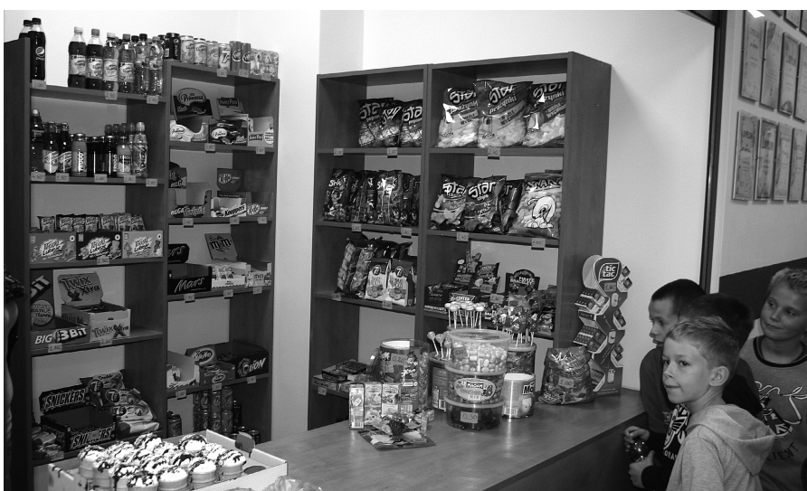
Podczas przerw lekcyjnych, przed sklepikiem przez cały czas stoi kolejka uczniów

W poniedziałek 24 września w budynku szkoły w Jastarni otwarto sklepik.