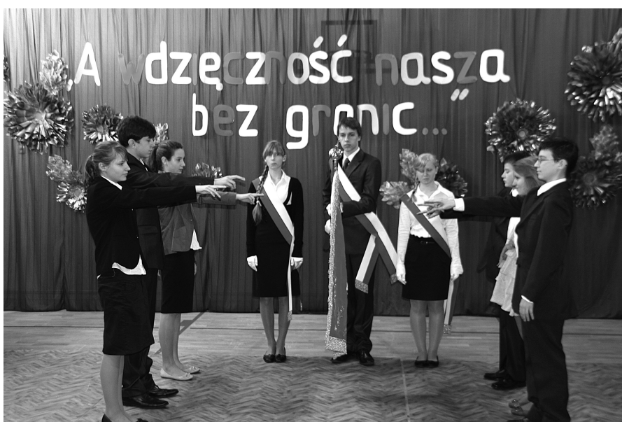
Delegacje pierwszych klas ślubują na sztandar