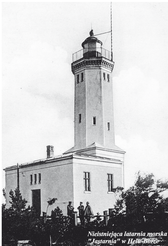
Nieistniejąca już latarnia morska w Borze

skojarzymy sobie, że w obęściu każdego gospodarstwa domowego zazwyczaj sadzono drzewa liściaste, owocowe lub ozdobne, nasze zadanie stanie się łatwiejsze. Po kilkunastominutowych poszukiwaniach można rzeczywiście znaleźć miejsce, gdzie rośnie kilka drzew liściastych (w lesie sosnowym to rzuca się w oczy), a w niedalekim ich sąsiedztwie znajduje się zarośnięty dół, w którym można się dopatrzeć leja po wybuch sprzed kilkudziesięciu lat. Tak więc w ten sposób można odnaleźć miejsce usytuowania latarni morskiej w Borze, uczucie obcowania z historią na pewno wynagrodzi nam wszelkie niedogodności związane z dotarciem w to miejsce.