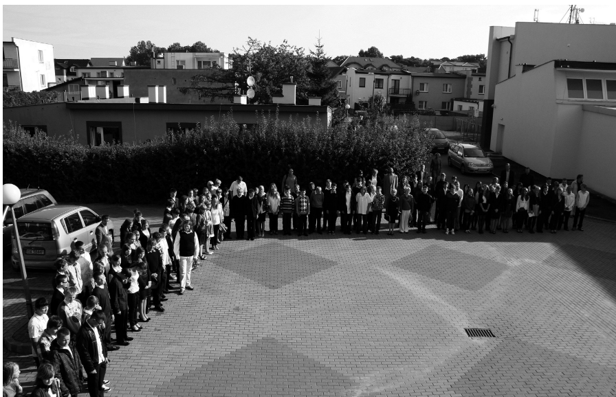
Rozpoczęcie roku szkolnego w gimnazjum im. Jana Pawła II

W szkole podstawowej w Jastarni witało go, mniej lub bardziej entuzjastycznie, około 250 uczniów klas I–VI, 75 uczniów z czterech oddziałów przedszkolnych oraz 16 przedszkolaków z placówki przedszkolnej w Kuźnicy. Razem z nimi kolejny rok szkolny rozpoczęło 35 nauczycieli oraz 11 pracowników administracji i obsługi. Jastarniańskie gimnazjum także rozpoczęło rok szkolny. Tutaj powitało go 130 uczniów, 18 nauczycieli i 5 pracowników administracji i obsłu-