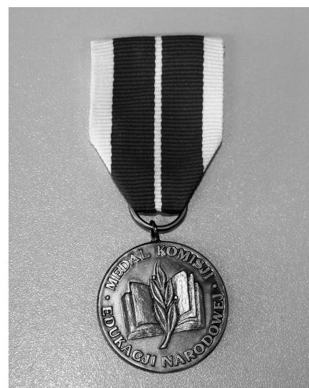
Medal Komisji Edukacji Narodowej został po raz pierwszy przyznany mieszkańcowi naszej gminy