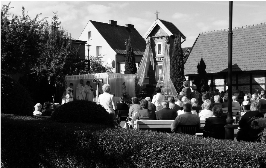
Msza odpustowa była także ostatnią tegoroczną mszą odprawianą przy kaplicy

W niedzielę 2 września przy kaplicy św. Rozalii odprawiono odpustową mszę, w której wzięło udział ponad dwieście osób.