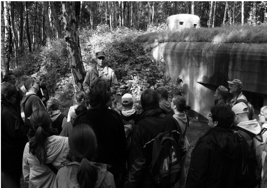
Wiedza historyczna przekazywana w ten sposób, zostanie w pamięci na dłużej