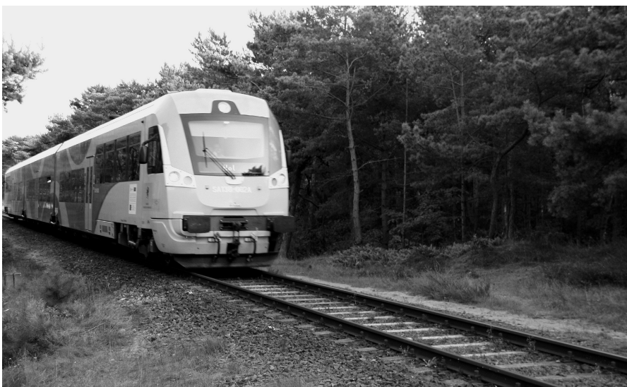
Jeden z ostatnich pociągów przejeżdżających przez Półwysep Helski. Następny będzie przed świętami Bożego Narodzenia

Następnie wzdłuż całej linii kolejowej zostały ułożone nowe szyny, więc dla każdego stało się jasne, co wkrótce tutaj się będzie działo.