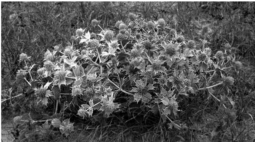
Czy mikołajki nadmorskie znowu będą częstymi roślinami na naszych wydmach?

W kwietniu 2009 roku pracownicy Nadmorskiego Parku Krajobrazowego zebrali 5 sztuk mikołajka nadmorskiego do dalszego rozmnożenia przez Związek Międzygminny Zatoki Puckiej w Swarzewie. Pod koniec marca bieżącego roku odbyły się nasadzenia mikołajka w 46 wcześniej wytypowanych miejscach. Co prawda, sadzonki zostały posadzone głównie na wydmach nadmorskich, gdzie istnieje zakaz chodzenia, jednak istnieje uzasadniona obawa, że część z nich zostanie zniszczona.