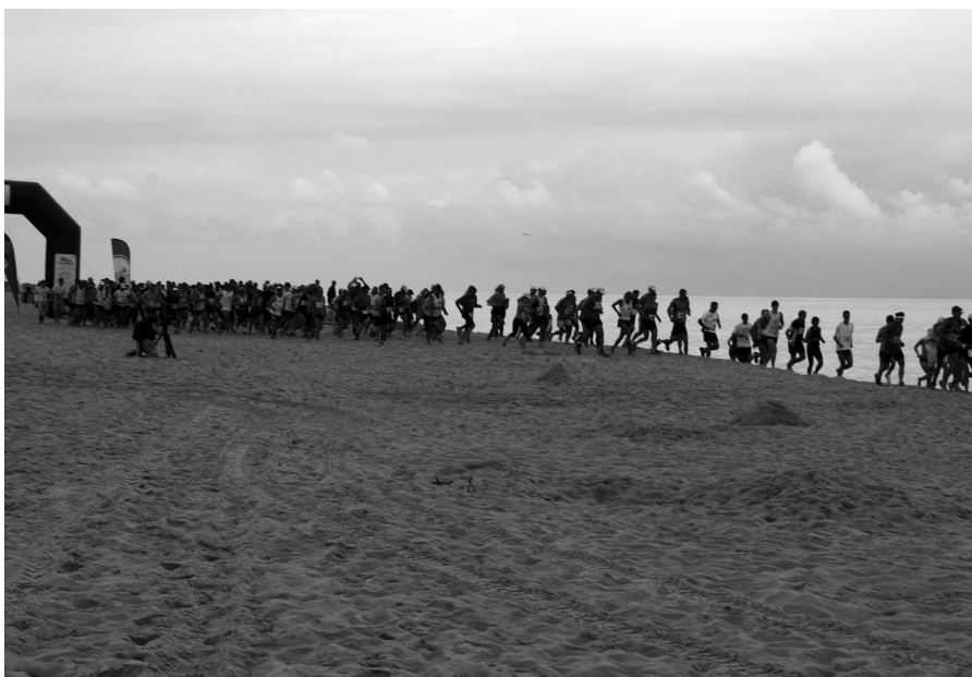
Ponad stu zawodników biegnących po plaży to widok dość imponujący

W sobotę 25 sierpnia na plaży morskiej Półwyspu Helskiego odbył się III Bałtycki Maraton Brzegiem Morza.