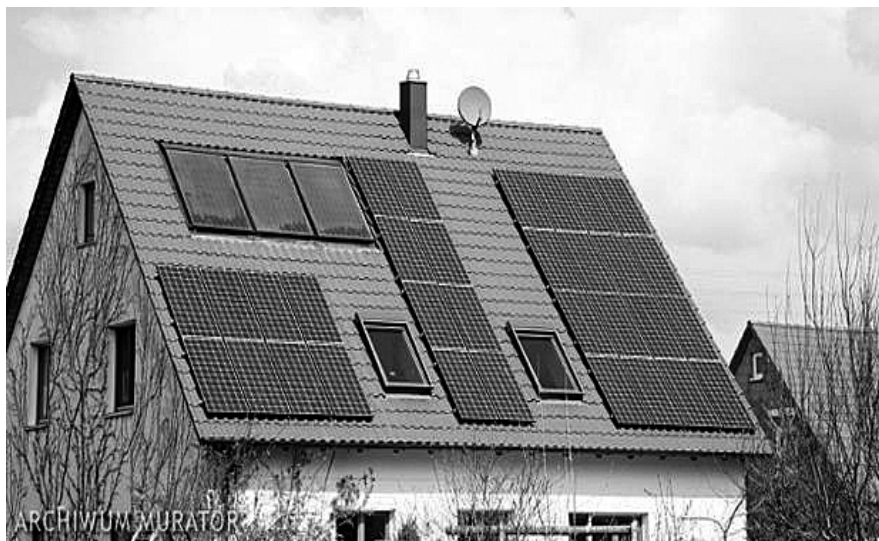
Baterie słoneczne na dachach domów są coraz częstszym widokiem

nych gmin zakładają w swoich miejscowościach solary, a władze Jastarni jakoś nic nie czynią w tym kierunku?