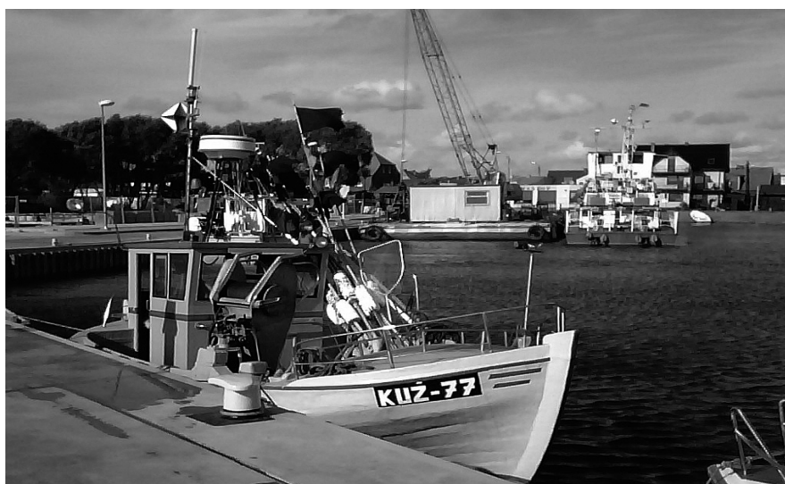
Przystań rybacka w Kuźnicy przedstawia sobą widok bardzo imponujący

zmurszały i nie nadawał się do remontu. Zaznaczyć trzeba, że wykonanie krzyża w całości finansowane jest ze zbiórki społecznej. Zresztą wszystko zobaczymy podczas otwarcia portu już za niespełna miesiąc.