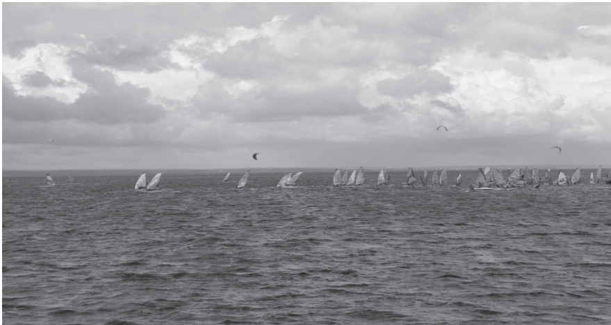
Tego dnia pogoda była wymarzona na rozgrywanie regat, warunki wiatrowe były doskonałe

Takie imprezy sportowe i nie tylko, organizowane przez działające latem w Jastarni firmy, są świetną promocją dla naszego miasta i wpływają na poszerzenie oferty skierowanej do wczasowiczów. Wypada tylko żałować, że takie organizowanie imprez przez podmioty sezonowe, ciągle jest w Jastarni rzadkością.