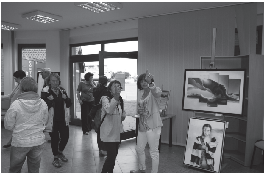
Zainteresowanie wystawianym malarstwem wśród gości wernisażu było duże

w ledwie uchwytny sposób. Ich forma pozwalała na swobodną interpretację.