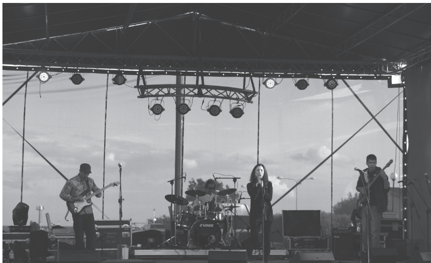
Podczas występu zespołu Stereotypy, część publiczności wyszła

podgrzanie atmosfery wśród publiczności, czy trudności z dojazdem.