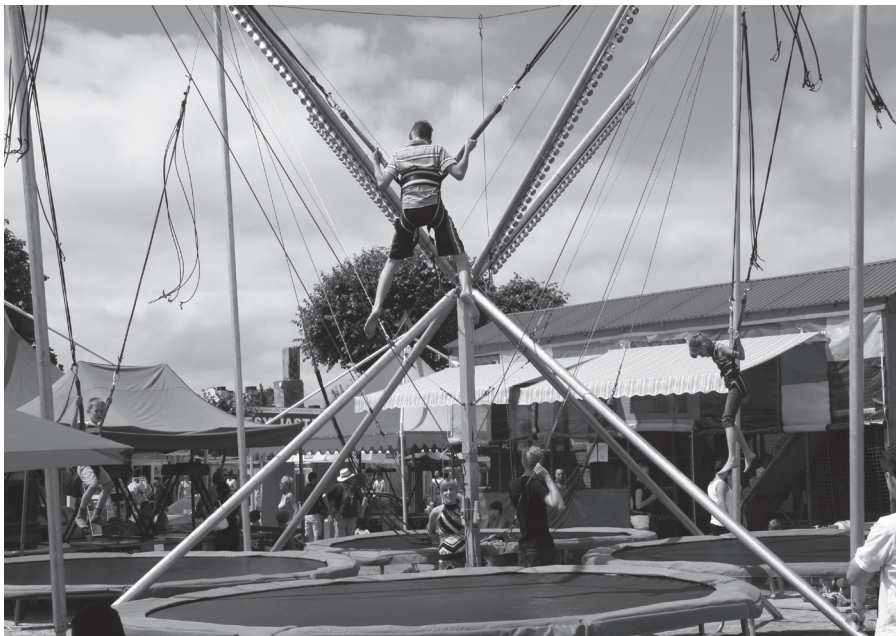
Raj dla dzieci i wytnienie dla ich rodziców

Pod tym względem oferta Jastarni przedstawia się wcale nie najgorzej. Mamy wesołe miasteczko, dużą dmuchaną zjeżdżalnię, tak zwaną kulkolandię z kilkoma rodzajami zjeżdżalni, to-