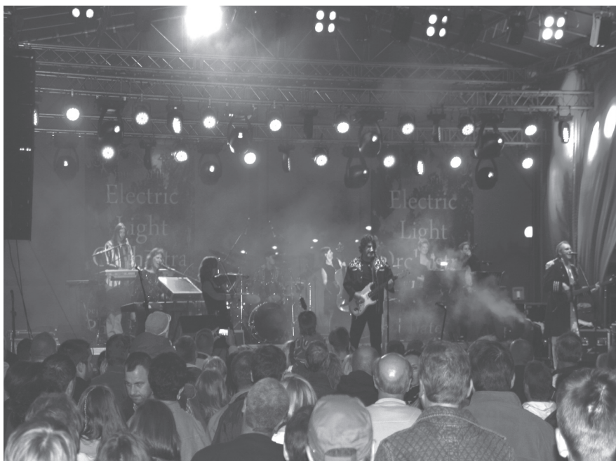
Z każdą chwilą publiczności na piątkowym koncercie przybywało

got Orchestra. Oczywiście, grane utwory pochodziły także z repertuaru brytyjskiej grupy muzycznej. Koncert trwał około półtora godziny i przez bywalców imprez odbywających się w porcie został uznany za najlepszą, jak dotąd, tegoroczną letnią imprezę.