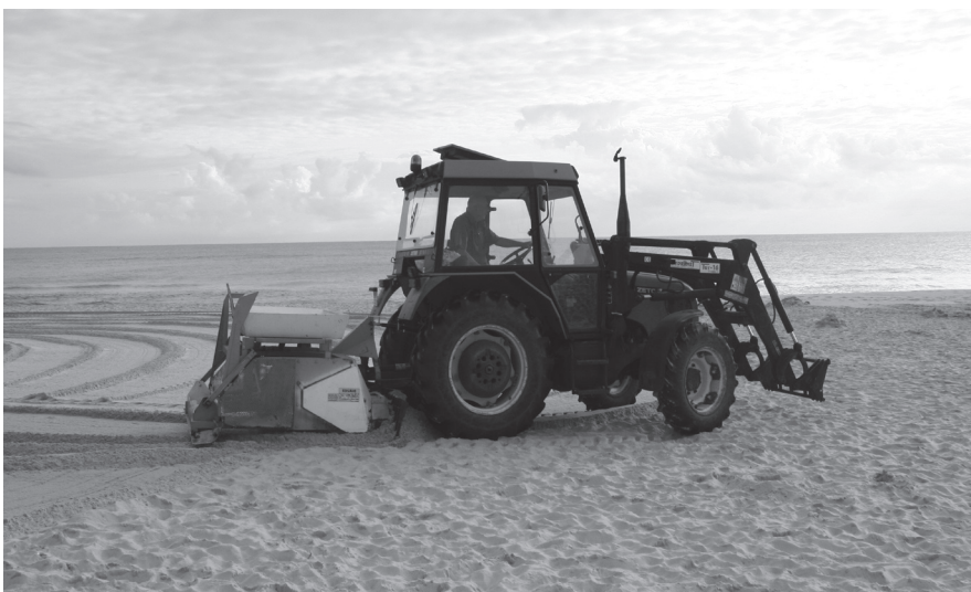
Mechaniczne czyszczenie plaży z konieczności musi odbywać się rano