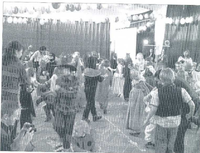
Dzieci świetnie się bawily, a ich rodzice byli przejęci nawet bardziej niż one same

W piątek 28 stycznia na sali gimnastycznej szkoły podstawowej w Jastarni odbył się bal karnawałowy dla najmłodszych dzieci z naszej gminy. Wzięło w nim udział ponad sto dzieci, każde z nich przebrane za jakąś postać, z tym że najwięcej było księżniczek oraz Spidermanów. W balu wzięły udział nie tylko dzieci z Jastarni, ale i z Kuźnicy i Juraty, o których dowiedzenie zadbała szkoła podstawowa, poza tym niektórzy rodzice przywieźli swoje dzieci samochodami. Zabawy taneczne przeplatane były z konkursami dostosowanymi do wieku ich