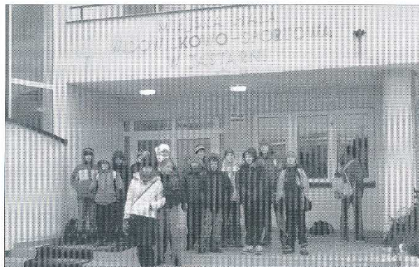
Zanim młodzież mogła wziąć udział w treningu, czekała przed drzwiami hali sportowej