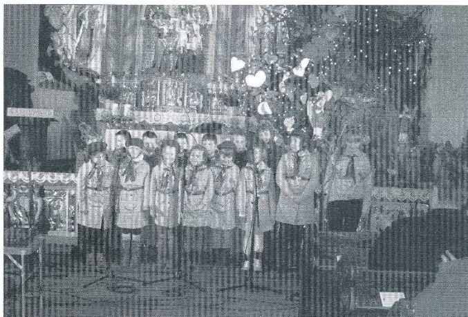
W kategorii chórów szkolnych klas 0–III drugie miejsce zajął chór 3 Gromady Zuchowej z Jastarni

W kategorii zespołów z gimnazjów i liceów, przyznano tylko pierwszą i drugą nagrodę. Pierwszą zdobył Zespół Gimnazjalny z Jastarni, drugą – zespół „Płomienie”, także z Jastarni.