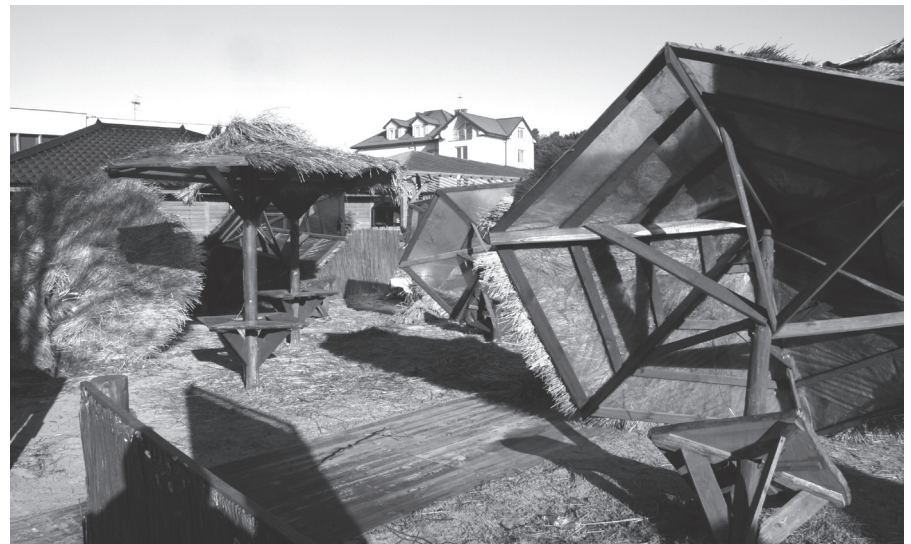
Takie widoki raczej nie są tym, czym byśmy się chcieli chwalić w Jastarni

Ludzie chodzący tego dnia po ulicach walczyli z podmuchami silnego wiatru, ale wcale nie to było ich największym problemem. Musieli także uważać na to, aby nie spadł na nich żaden element ze stojących przy głównej ulicy straganów. Stawiane na trzy letnie miesiące, powinny być po tym czasie rozbierane. Powinny, ale nie są. Z jednej strony mają one mało estetyczny wygląd i stanowią niezbyt chlubną wizytówkę naszego miasta. Po drugie zaś, stanowią one potencjalne niebezpieczeństwo dla przechodniów, gdyż w czasie silnych wiatrów ich elementy konstrukcyjne poddają się naporowi wiatru i nie wiadomo kiedy zaczną fruwać w powietrzu. Ponieważ żyjemy na terenie gdzie silne wiatry są czymś normalnym, takie sytuacje będą zdarzać się częściej.