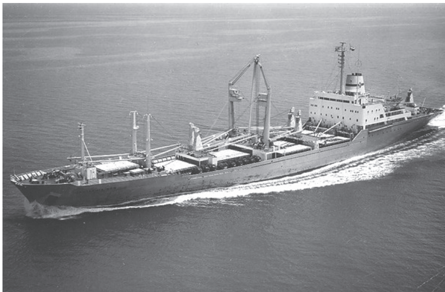
Ekspresowiec „Jastarnia Bór”

„Kuznica” i „Władysławowo”. Realizację kontraktu rozpoczęto w 1969 r., sfinalizowano w 1971. M/s „Jastarnia Bór”, długa na 166,5 m, szeroka na 23,3, o 10-metrowym zanurzeniu, zwodowana została 12 sierpnia 1970, przekazana jednak armatorowi już w następnym roku. Wyposażony w kabiny pasażerskie (12 miejsc) statek miał charakter uniwersalny: 3 pokłady, 6 ładowni