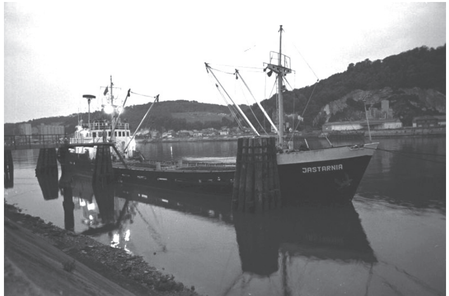
„Jastarnia” Polskiej Żeglugi Morskiej

Zanim jeszcze dawnemu „Seburgowi” odebrano nieoficjalną nazwę, w rejestrach floty pojawił się statek poświęcony Jastarni: 31 grudnia 1954 r. w Stoczni im. Ko-