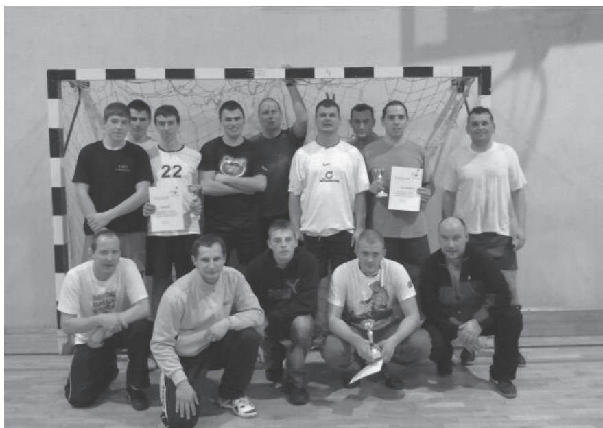
Po zakończeniu turnieju humory dopisywały wszystkim jego uczestnikom.

Mistrzem Jastarni 2011 w piłce halowej został zespół Gumisi w składzie: Mikołaj Kohnke, Krzysztof Dettlaff, Michał Boszke, Karol