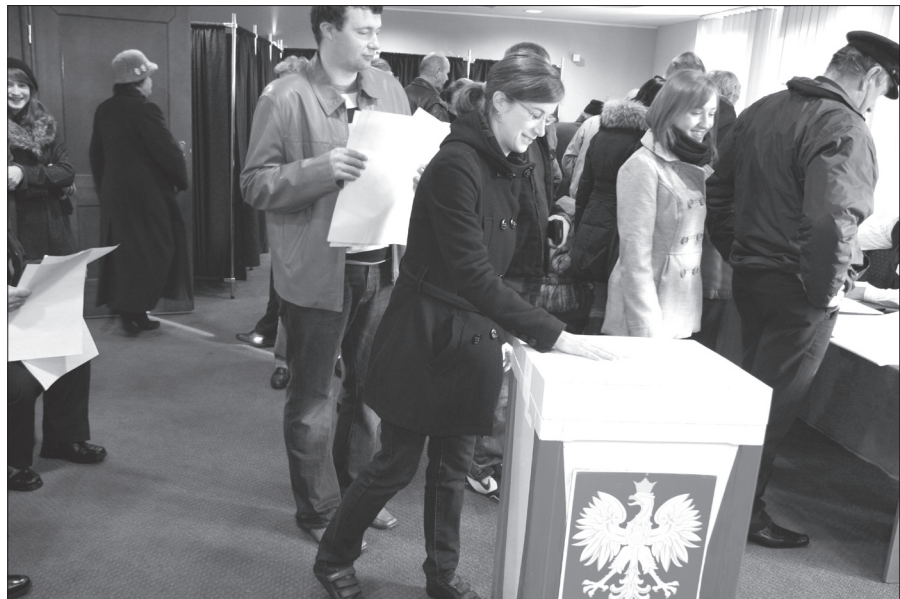
Tradycyjnie lokale wyborcze najbardziej zapelniały się po mszach świętych