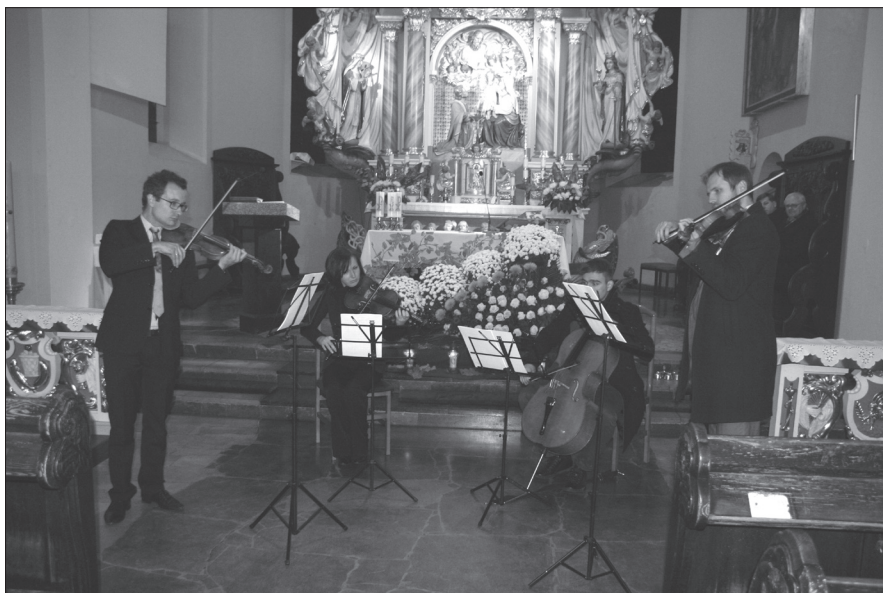
Kwartet smyczkowy „Tangueros Balticos” w trakcie koncertu