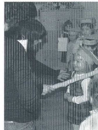
W Przedszkolu Parafialnym w Juracie, 21 października, 18 dzieci zostało pasowanych na przedszkolaków