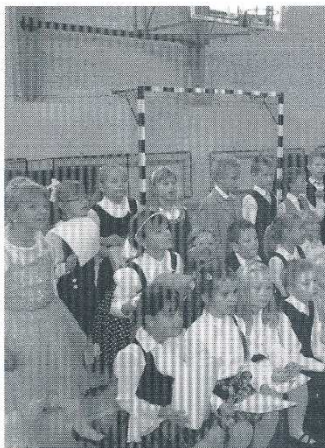
Przed chwilą odbyło się pasowanie, więc widzimy już pełnoprawnych uczniów