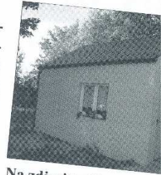
Na zdjęciu widać dwa kontenery, które zostały ze sobą połączone.

Kontenery posiadają instalację elektryczną i wodno-kanalizacyjną. Są to lokale z osobnymi wejściami, w których znajduje się jedno pomieszczenie z aneksem kuchennym oraz łazienką. W każdym z nich są grzejniki elektryczne i bojler. Aneks kuchenny stanowi wielo-