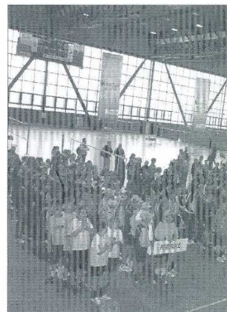
W turnieju brało udział ponad 600 zawodników, wśród nich dwie drużyny UKS Jastarnia

Siatkarze UKS-u występujący w rocznika 1997 w eliminacjach wygrali jeden mecz (z woj. dolnośląskim) i przegrali drugi (z woj. mazowieckim), co pozwoliło im rywalizować o miejsca 9-16. Jednak kolejne mecze zakończyły się przegraną chłopców, którzy zawody ukończyli na 16 miejscu.