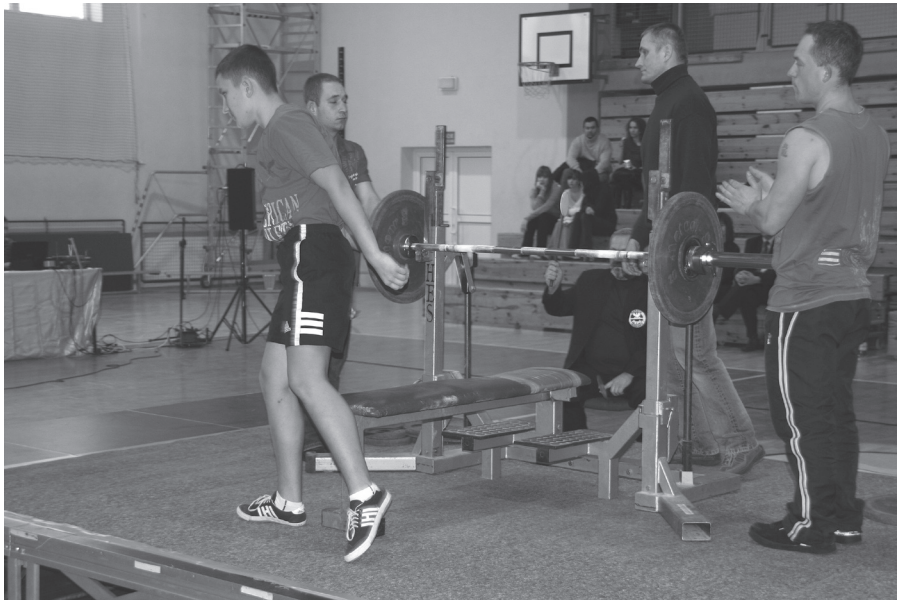
Kolejny zawodnik biorący udział w Mistrzostwach w chwilę po zaliczonym podejściu