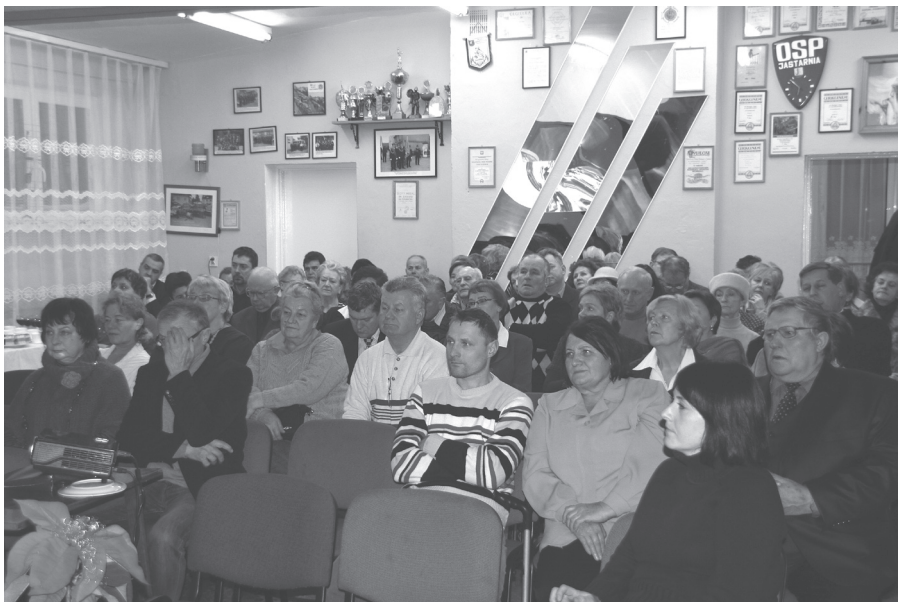
Sala remizy Ochotniczej Straży Pożarnej ledwo mogła pomieścić przybyłe osoby